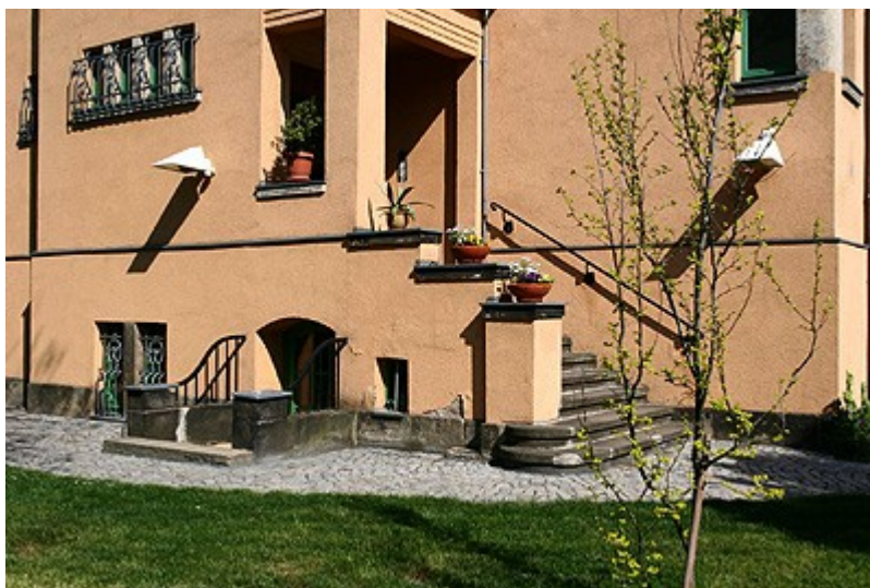
Außeneingang der Souterrainwohnung