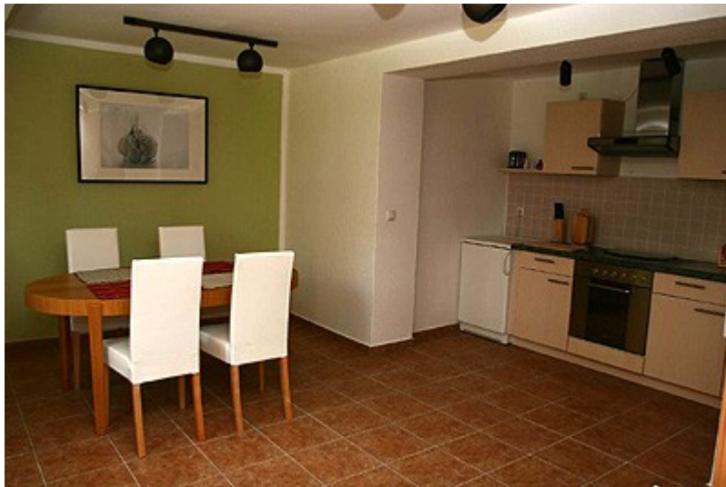
Die große Wohnküche