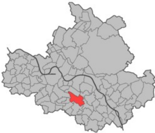
Strehlen im Stadtgebiet