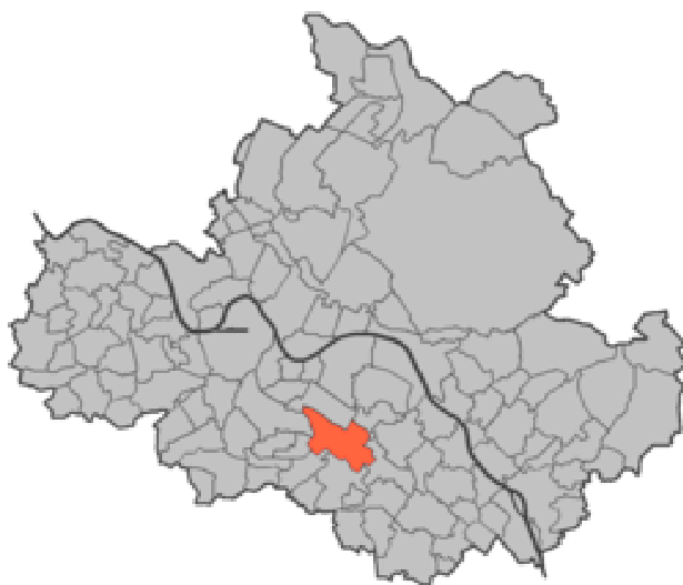
Strehlen im Stadtgebiet